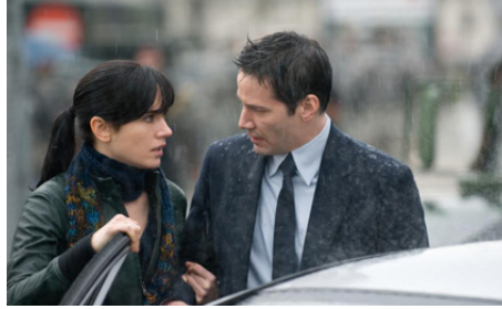
2008 LE JOUR OÙ LA TERRE S'ARRÊTA (The Day the Earth stood still) de Scott Derrickson avec K. Reeves