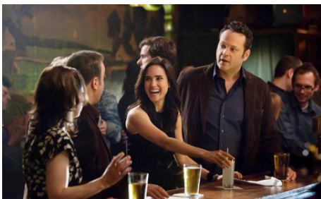
2011 LE DILEMME (The Dilemma) de Ron Howard avec Winona Ryder, Kevin James, Vince Vaughn