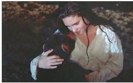
1985 PHENOMENA (Phenomena) de Dario Argento