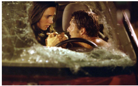
2003 HULK (Hulk) d'Ang Lee avec Eric Bana