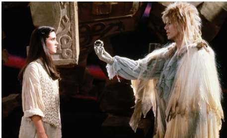
1986 LABYRINTHE (Labyrinth) de Jim Henson avec David Bowie