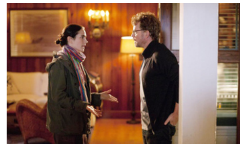
2012 STUCK IN LOVE (Stuck in Love) de Josh Boone avec Greg Kinnear