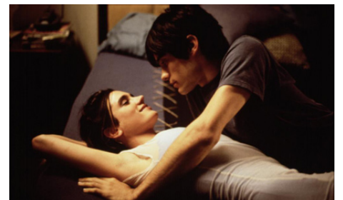
2000 REQUIEM FOR A DREAM (Requiem for a Dream) de Darren Aronofsky avec Jared Leto