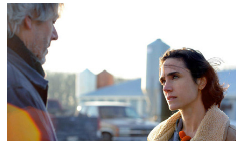
2014 ALOFT (Aloft) de Claudia Llosa avec Cillian Murphy