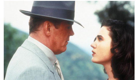
1996 LES HOMMES DE L'OMBRE (Mulholland Falls) de Lee Tamahori avec Nick Nolte