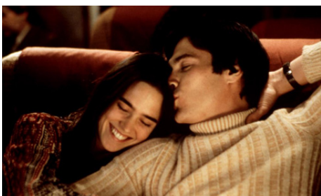
2000 LE FANTÔME DE SARAH WILLIAMS (Walking the Dead) de Keith Gordon avec Billy Crudup