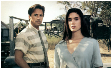
1990 HOT SPOT (The Hot Spot) de Dennis Hopper avec Don Johnson