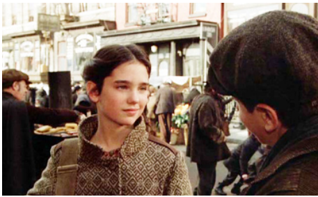
1984 IL ÉTAIT UNE FOIS EN AMÉRIQUE (Once upon a Time in America) de Sergio Leone avec Scott Tyler