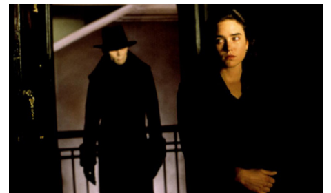
1998 DARK CITY (Dark City) d'Alex Proyas avec Richard O'Brien