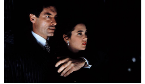
1991 ROCKETEER (The Rocketeer) de Joe Johnston avec Timothy Dalton