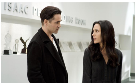
2014 UN AMOUR D'HIVER (Winter's Tale) d'Akiva Goldsman avec Colin Farrell