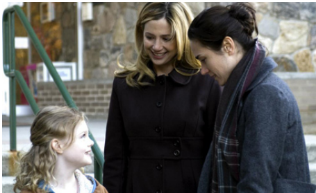
2007 RESERVATION ROAD (Reservation Road) de Terry George avec Elle Fanning, Mira Sorvino