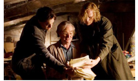
2008 CŒUR D'ENCRE (Inkheart) de Iain Softley avec Brendan Fraser, Jim Broadbent