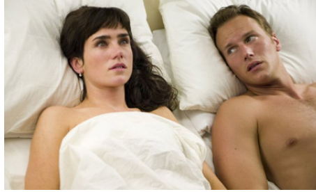
2006 LITTLE CHILDREN (Little Children) de Todd Field avec Patrick Wilson