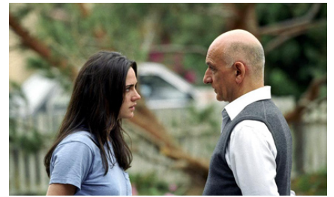
2003 HOUSE OF SAND AND FOG de Vadim Perelman avec Ben Kingsley