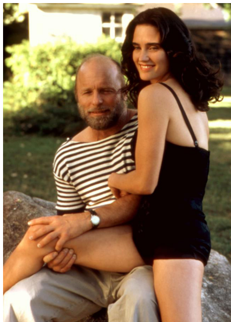
2000 POLLOCK (Pollock) d'Ed Harris avec Ed Harris