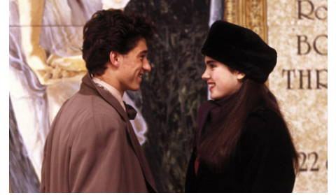
1988 SOME GIRLS (Some Girls) de Michael Hoffman avec Patrick Dempsey