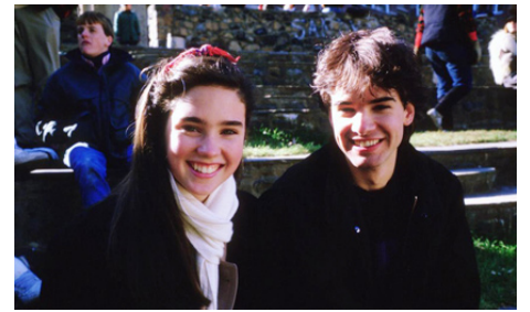
1985 SEVEN MINUTES IN HEAVEN (Seven Minutes in Heaven) de Linda Feferman avec Alan Boyce