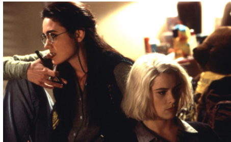
1995 FIÈVRE À COLUMBUS UNIVERSITY (Higher Learning) de John Singleton avec Kristy Swanson