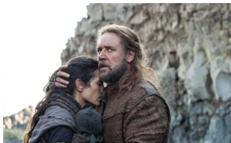
2014 NOÉ (Noah) de Darren Aronofsky avec Russell Crowe