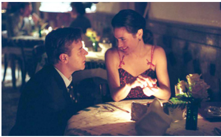
2001 UN HOMME D'EXCEPTION (A Beautiful Mind) de Ron Howard avec Russell Crowe